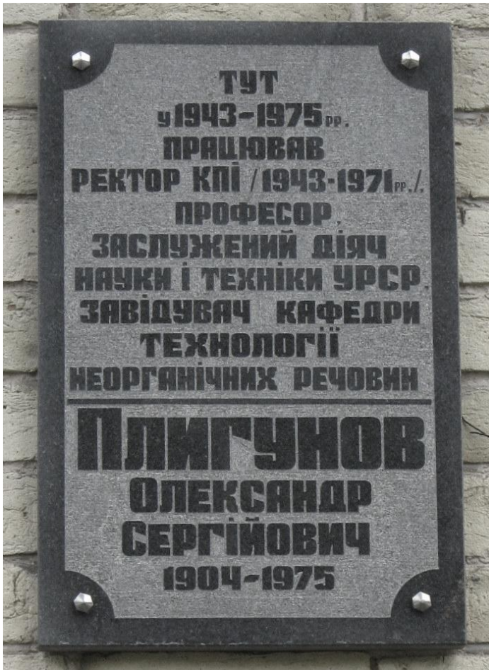
На стіні хіміко-технологічного факультету (корпус 4) Національного технічного університету України «Київський політехнічний інститут імені Ігоря Сікорського» у 1998 році встановлена гранітна меморіальна дошка на честь ректора професора Олександра Сергійовича Плигунова