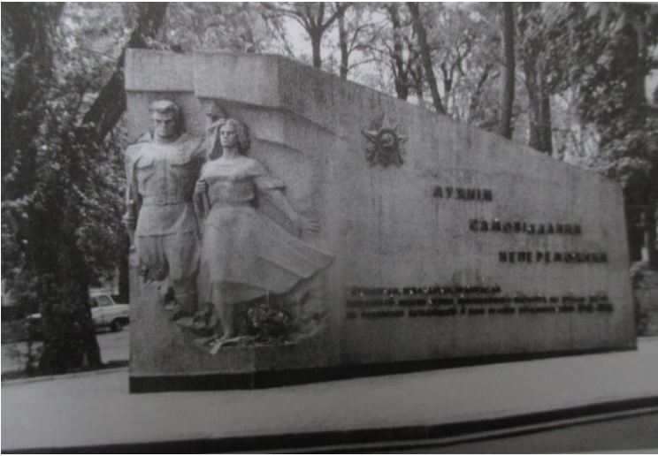
Пам'ятник співробітникам і студентам КПІ, загиблим у війні 1941–1945 рр. (автор Є. П. Вересов, скульптори О. Г. Суровцева та Г. Н. Морозова, 1967 р.)