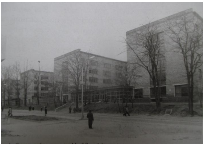
Аудиторні корпуси №№ 13, 14, 15, 16 Київського політехнічного інституту, побудовані у 1967 р.