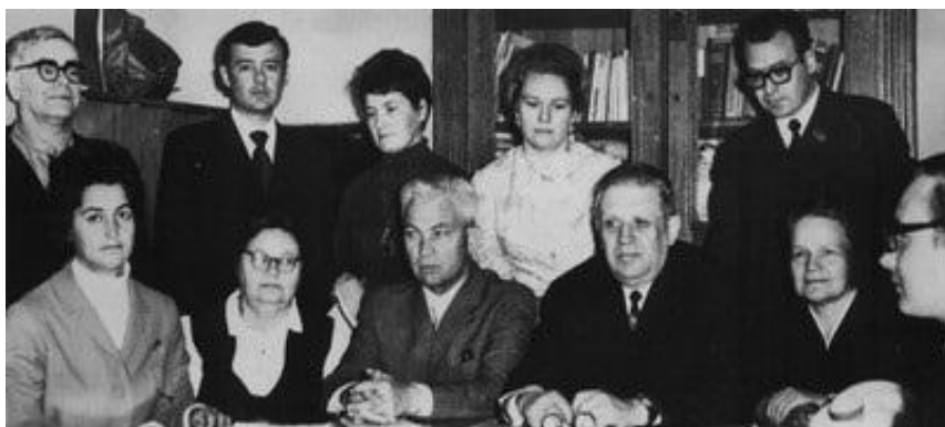
Καθεδρα ΤΗΡ μα ΖΧΤ, 1973 ρικ