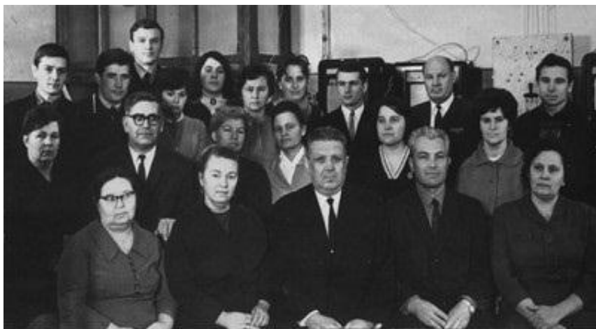
Καθεδρα ΤΗΡ μα ΖΧΤ, 1970 ρικ