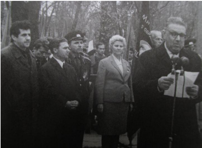
Ректор КПІ О. С. Плигунов на відкритті пам'ятника співробітникам і студентам КПІ, загиблим у війні 1941–1945 рр. (5 листопада 1967 р.)