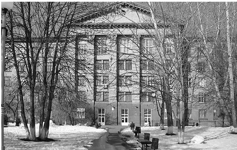
Радіокорпус (корпус № 12) Київського політехнічного інституту, побудований у 1958 р.