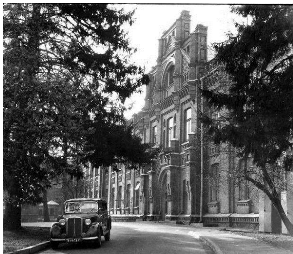
Хімічний корпус Київського політехнічного інституту (1950-ті роки).