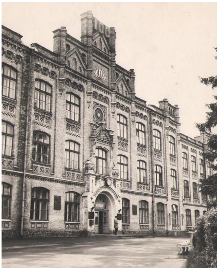
Головний корпус Київського політехнічного інституту (1970 р.)