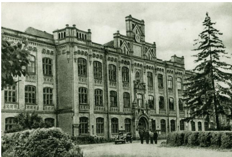
Головний корпус Київського політехнічного інституту (1950-ті роки).