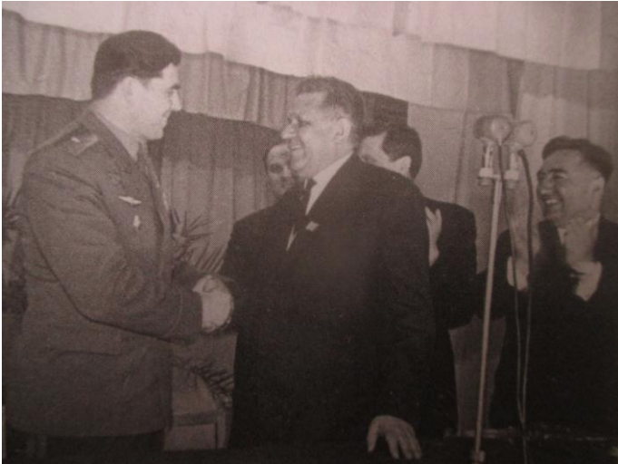
Зустріч О. С. Плигунова з космонавтом Г. Т. Береговим. (18 лютого 1969 р.).